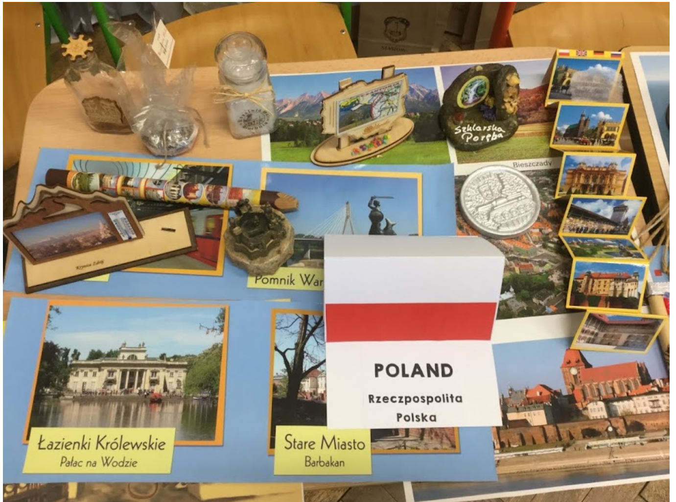
Łazienki Królewskie Pałac na Wodzie