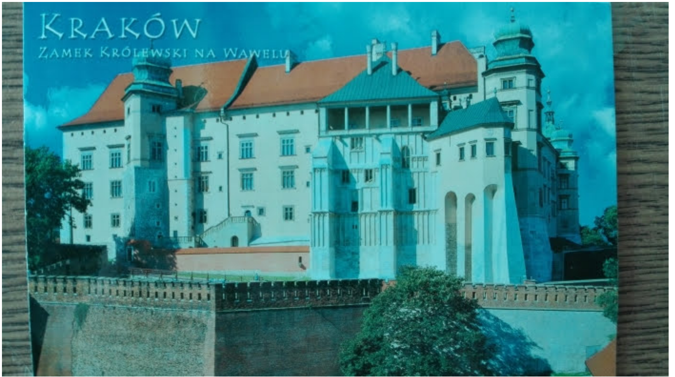
KRAKÓW ZAMEK KRÓLEWSKI NA WAWELU